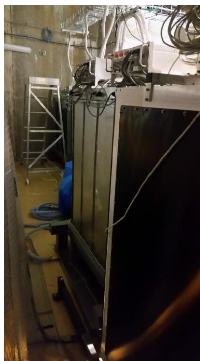
図 2 INGRID 検出器の一部

また、ニュートリノビームのシミュレーションにも従事することができた。ニュートリノビームのスペクトルやレート、不定性は外部実験(陽子・炭素標的の散乱のデータ)をもとに原子核散乱モデルを最適化してシミュレーションで評価するのだが、INGRID 検出器におけるビームの不定性は古い外部実験結果に基づいて評価されていた。そこで私は J-PARC ビームグループとともに最新の外部実験結果を用いて不定性をアップデートした。解析を通して基本的なモデル最適化の手法を学ぶことができた。私は普段はビームを道具として使っている立場であり、どちらの体験も刺激的なものだった。