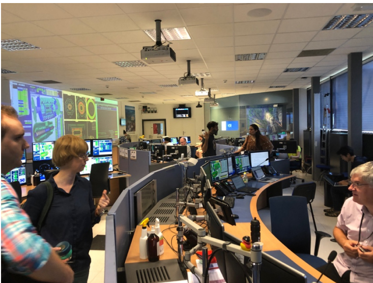
写真 2. ATLAS 検出器の運転を制御するコントロールルームの様子。LHC の運転期間中は各検出器の運転状況をモニターするシフトが組まれ、1シフト8時間、3交代制で24時間検出器の監視・制御を行う。

Photo 1. TGC detector maintenance activities. The ATLAS Japan Group has led the development and operation of the 26-m-long muon detector, the Thin Gap Chamber (TGC), installed in the outermost layer of the ATLAS detector. When problems arise with the gas detectors, control hardware, or cable routing, or during routine maintenance, members directly access the detector located 100 m underground to replace components and reconfigure cabling.