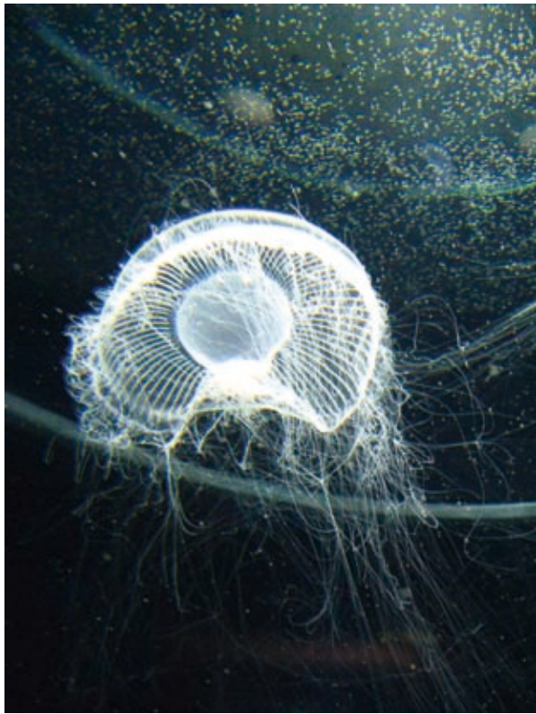
図 1：オワンクラゲ。イクオリンが発する青い光を GFP が緑に変え、緑色に光る（この写真では白く見える）。

昨年、日本中が沸いた 4 人の日本人ノーベル賞受賞者の中で、ノーベル化学賞を受賞された下村脩先生の受賞理由は、「緑色蛍光タンパク質（GFP）の発見と開発」という業績に対してでした。この光るタンパク質が、オワンクラゲ（図 1）という発光クラゲが作り出すものであるということを知って、最先端の科学にまた新たな興味を持った方も少なくないのではないかと思います。