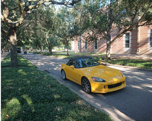
図 1. 車社会のテキサスとあって車通学の学生が多く、マニアックな日本車の姿も見られる。無論、ビッグスリーも健在である。